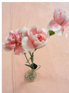
テーブルの花 カーネーション