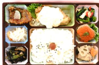
本日の食事 ぐらんま亭