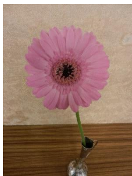
卓上の花 ガーベラ